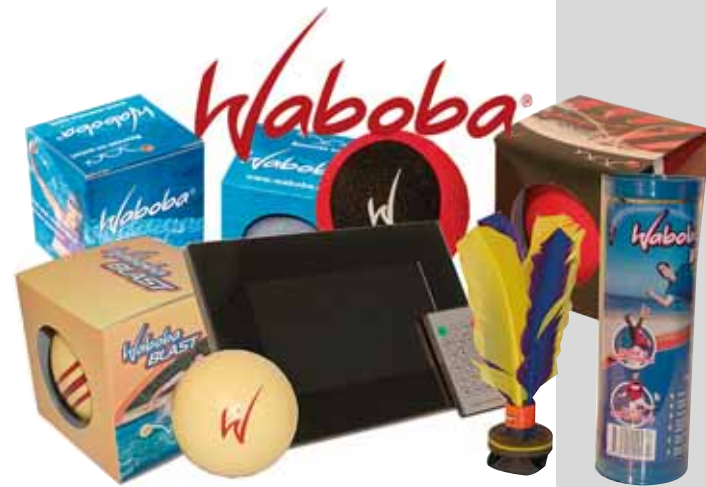
Das Waboba Promotionpaket für den Fachhandel mit digitalem Bilderrahmen

In enger Zusammenarbeit mit dem Spielwaren-Marketing-Vertrieb (SMV) als Außendienst vor Ort bildet sunflex ein kleines, aber äußerst schlagkräftiges Team. □